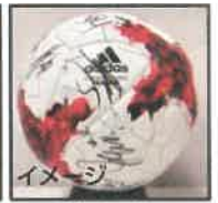
⑥ サイン入り Jリーグ公式試合球